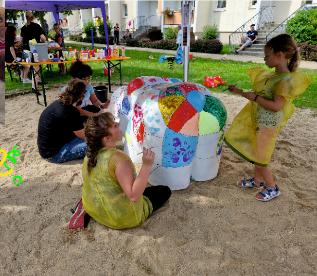
... das Ergebnis kann sich sehen lassen.