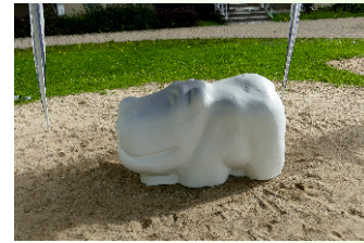
Kindermalaktion - Nilpferd